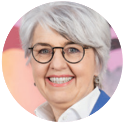
Bundesrätin Elisabeth Baume-Schneider Vorsteherin des Eidgenössischen Departements des Innern

Elisabeth Baume-Schneider studierte Wirtschafts- und Sozialwissenschaften in Neuenburg. Sie war Sozialarbeiterin, Regierungsrätin und Ständerätin. 2022 wurde sie in den Bundesrat gewählt und ist seit 2024 Vorsteherin des Departements des Innern, EDI.