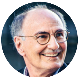
Prof. em. Dr. med., Dr. PH Felix Gutzwiller emeritierter Professor der Universität Zürich, alt National- und Ständerat

Anne Lévy studierte politische Wissenschaften an der Universität Lausanne und erwarb ein EMBA an der Universität Fribourg. Sie arbeitet seit mehr als zwanzig Jahren im Bereich der öffentlichen Gesundheit. So leitete sie den Gesundheitsschutz des Kantons Basel Stadt und war in New York für die UNO im Bereich Drogenpolitik & Suchtprävention tätig. Seit 2020 ist sie Direktorin des Bundesamtes für Gesundheit.