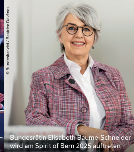
Bundesrätin Elisabeth Baume-Schneider wird am Spirit of Bern 2025 auftreten

Die zehnte Ausgabe des Spirit of Bern beschäftigt sich mit der aktuellen Krise im Gesundheitswesen und beleuchtet die Gründe für das Kostenwachstum. Im Zentrum der Tagung stehen innovative Lösungsansätze, neue Versorgungsmodelle und internationale Vergleichsmodelle, die helfen können, das aus dem Gleichgewicht geratene Gesundheitswesen wieder ins Lot zu bringen.