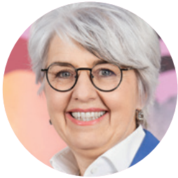
Bundesrätin Elisabeth Baume-Schneider Vorsteherin des Eidgenössischen Departements des Innern

Elisabeth Baume-Schneider studierte Wirtschafts- und Sozialwissenschaften in Neuenburg. Sie war Sozialarbeiterin, Regierungsrätin und Ständerätin. 2022 wurde sie in den Bundesrat gewählt und ist seit 2024 Vorsteherin des Departements des Innern, EDI.