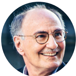
Prof. em. Dr. med., Dr. PH Felix Gutzwiller emeritierter Professor der Universität Zürich, alt National- und Ständerat