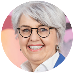
Bundesrätin Elisabeth Baume-Schneider Vorsteherin des Eidgenössischen Departements des Innern

Elisabeth Baume-Schneider studierte Wirtschafts- und Sozialwissenschaften in Neuenburg. Sie war Sozialarbeiterin, Regierungsrätin und Ständerätin. 2022 wurde sie in den Bundesrat gewählt und ist seit 2024 Vorsteherin des Departements des Innern, EDI.