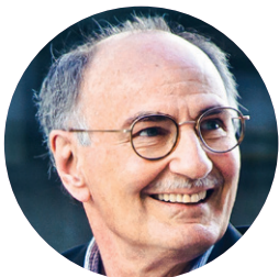
Prof. em. Dr. med., Dr. PH Felix Gutzwiller emeritierter Professor der Universität Zürich, alt National- und Ständerat