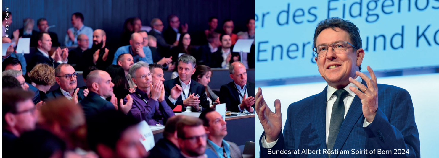
Bundesrat Albert Rösti am Spirit of Bern 2024