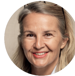
Sonja Hasler Moderatorin beim SRF